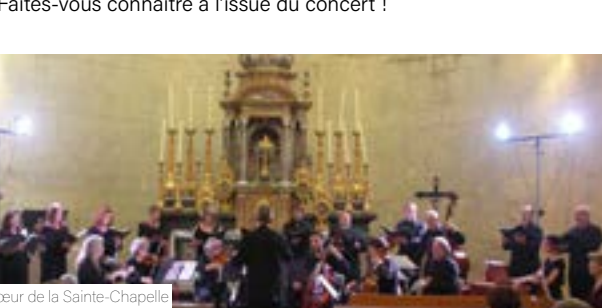
Chœur de la Sainte-Chapelle

Le chœur de la Sainte-Chapelle, créé en 2021, oriente sa recherche vers le répertoire a capella de la Renaissance. Il apprécie également de chanter de concert avec différents chœurs de la région le répertoire baroque, accompagné d'ensembles instrumentaux. Sous la direction de Benoît Magnin, cet ensemble vocal recrute des chanteurs-lecteurs avertis. L'ensemble se produit en la Sainte-Chapelle, dans la Savoie et la Haute-Savoie. Les répétitions se font à la Cité des Arts et à la Sainte-Chapelle. Vous êtes chanteur et souhaitez rejoindre l'ensemble ? Faites-vous connaître à l'issue du concert !